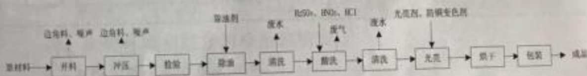
图 2-1 项目生产工艺流程及产污节点图